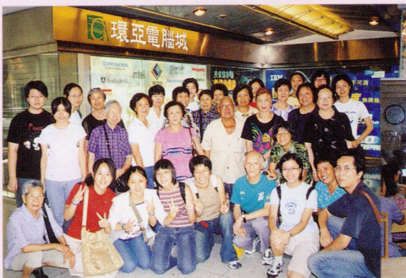
▲ 「電腦系」往參觀電腦城