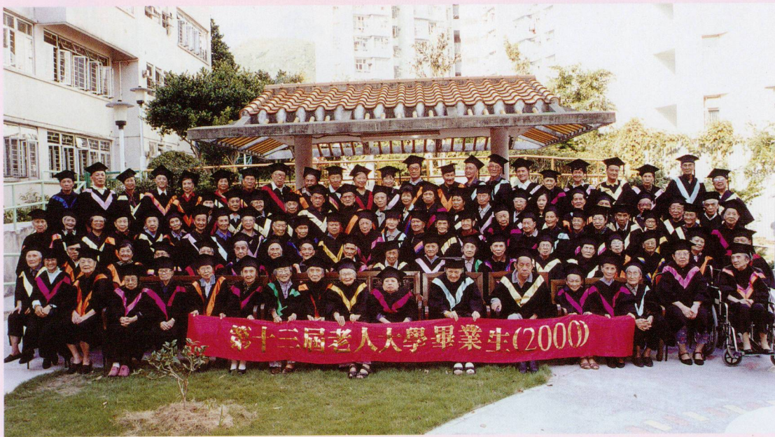
第十三屆（二〇〇〇年度）老人大學畢業照

學生需準時上課，交功課及考試合格，方可畢業。成功修滿三個學院課程者將獲頒發才華獎，並於一九九九年增設榮譽生，藉此鼓勵取得優異成績的同學，而順利畢業的同學也會穿著畢業袍及戴四方帽，參加每年一度的畢業典禮呢！