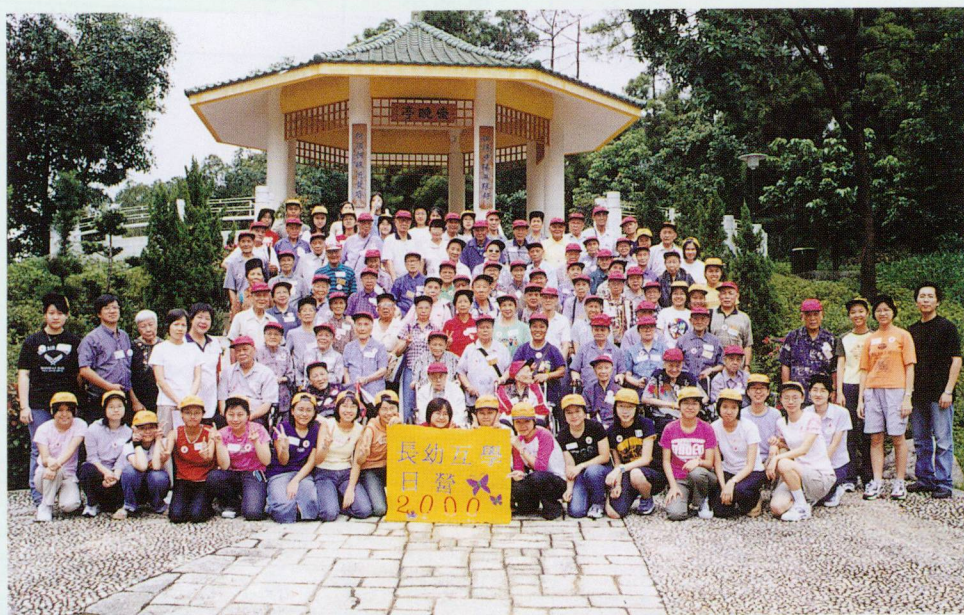
▲「長幼互學」計劃已到尾聲，當然要舉辦一個大旅行輕鬆吓。嘩！好多人呀！齊齊影張靚相先！

為了鼓勵同學們的參與及努力，本計劃特別設立了金、銀及銅獎，以示嘉許。評分標準以各人的投入程度、積極參與及主動創新而定。而他們的頒獎典禮也會與「老人大學」的畢業典禮一同舉行呢！