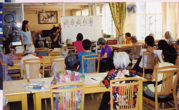
▼ 「中文系」的同學專心地學習生字