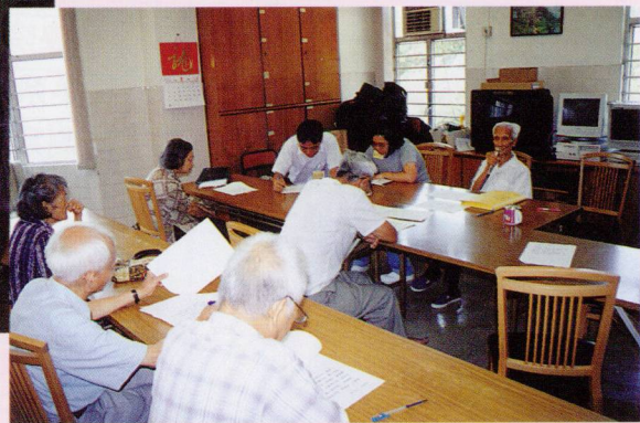
▼ 「語文系」的同學正在留心細聽鍾老師的講解