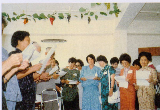
▲ 當任港督夫人到訪

港督衛奕信爵士夫人在一九八七年八月到本院參觀，與院友談笑甚歡。港督夫人參觀了院內的各項設施，如睡房、健身室、電視廳和活動室等。除此以外，她亦觀看了院友的烹飪示範，並獲院友送贈自製的掛毯作為紀念呢！