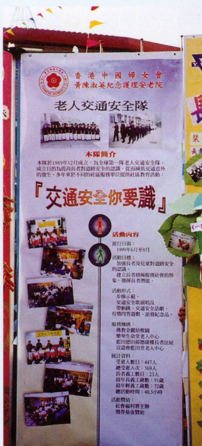
▲ 老有所為活動計劃

本院的交通安全隊在一九九九年得到社會福利署的撥款，舉辦一個名為「交通安全你要識」的活動，到老人中心及幼稚園推廣道路安全知識，並獲選為該年度東九龍總區傑出大型「老有所為活動計劃」獎，足見隊員在社區義務工作的傑出表現。